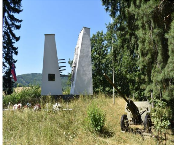
Obrázok 14: Pamätník SNP nad obcou Prochot.