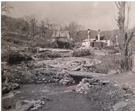
Obrázok 9: Pozostatky dvora rodiny Kušnierovcov po vypálení.