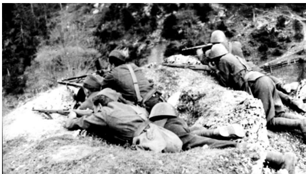
Obrázok 1: Oddiel Thälmann.