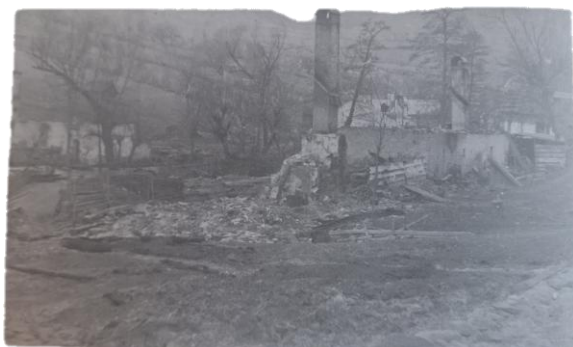
Obrázok 5: Obec po vypálení.