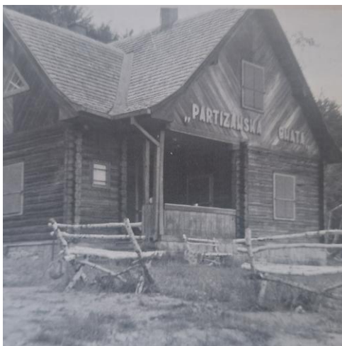
Obrázok 15: Chata G. Medrického nad obcou.