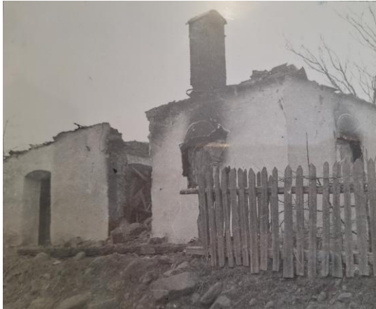
Obrázok 7: Obec po vypálení.