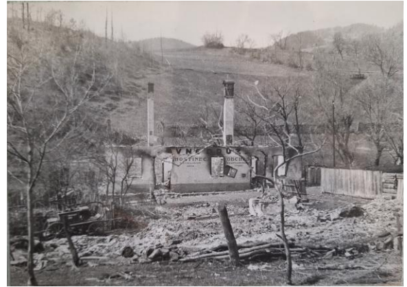
Obrázok 8: Zhorenisko potravného družstva.