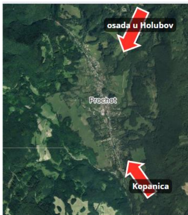
Mapa 3 - Smery útoku z 20.-21. januára 1945