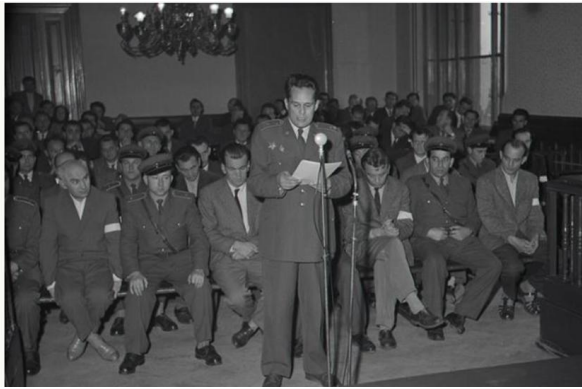
Obrázok 13: Proces s obžalovanými príslušníkmi protipartizánskej jednotky Edelweiss.