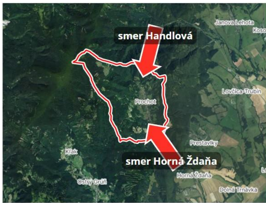
Mapa 2 Smer útoku z roku 1945