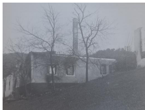
Obrázok 6: Obec po vypálení.