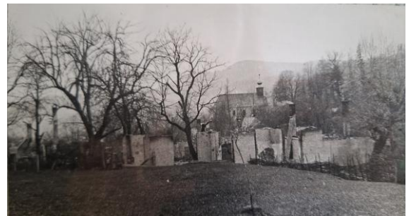
Obrázok 10: Obec po vypálení.