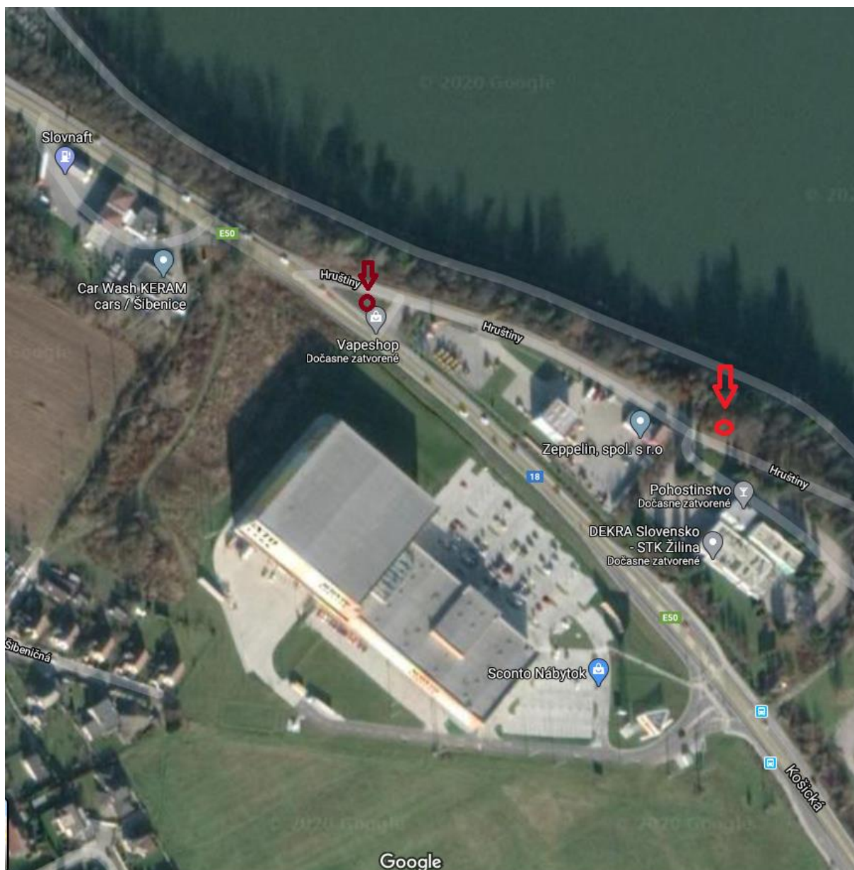
Obr. č. 11: Súčasná mapa miesta (Križ na Šibeniciach a naše Božie muky pri Šibeniciach)