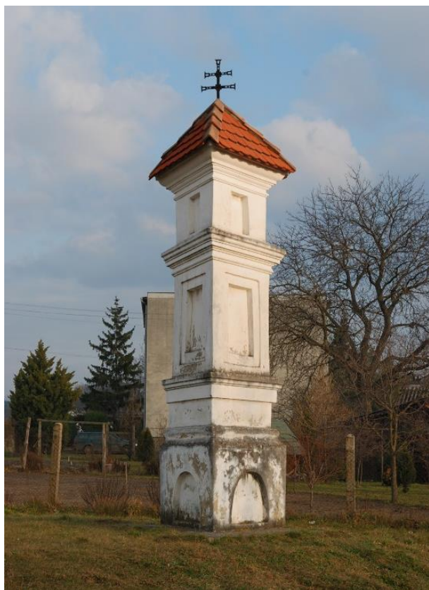
Obr. č. 3: Božie muky v Malackách