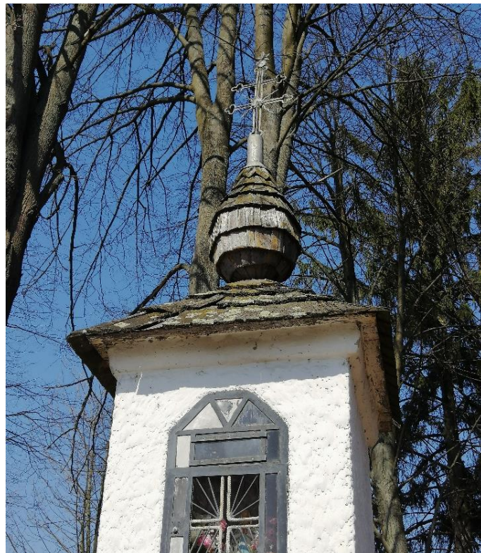
Obr. č. 8: Bližší pohľad na šindľovú strechu s dvojkrížom