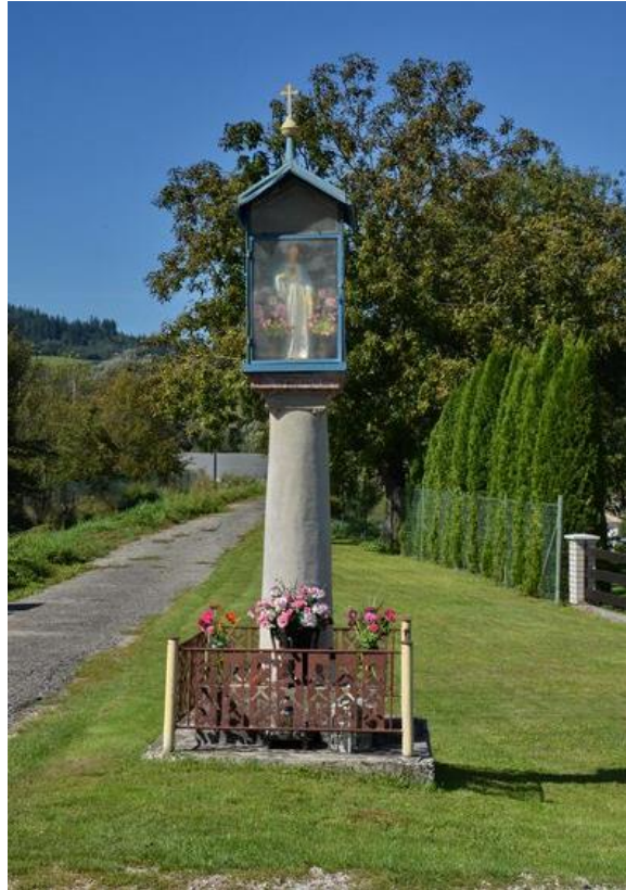
Obr. č. 1: Božie muky v Maršovej