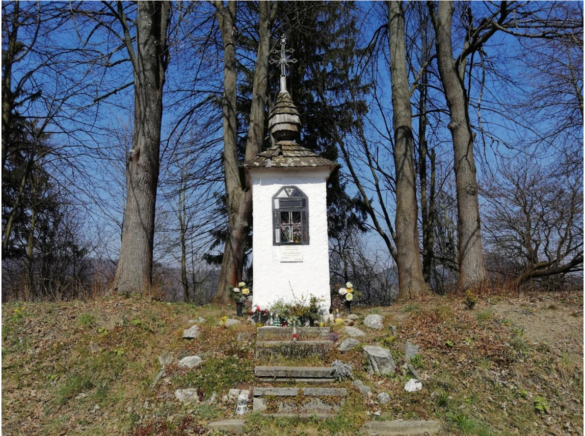
Obr. č. 7: Božie muky pri Šibeniciach (Hruštinách)