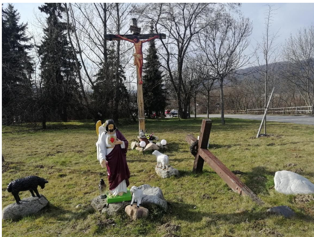
Obr. č. 4: Kríž na Šibeniciach