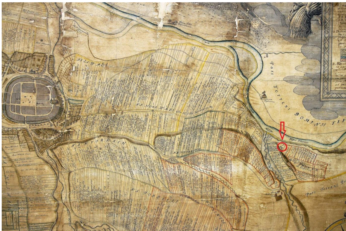
Obr. č. 5: Mapa Žiliny a okolia od Michala Ruttkaya-Nedeckého z roku 1747