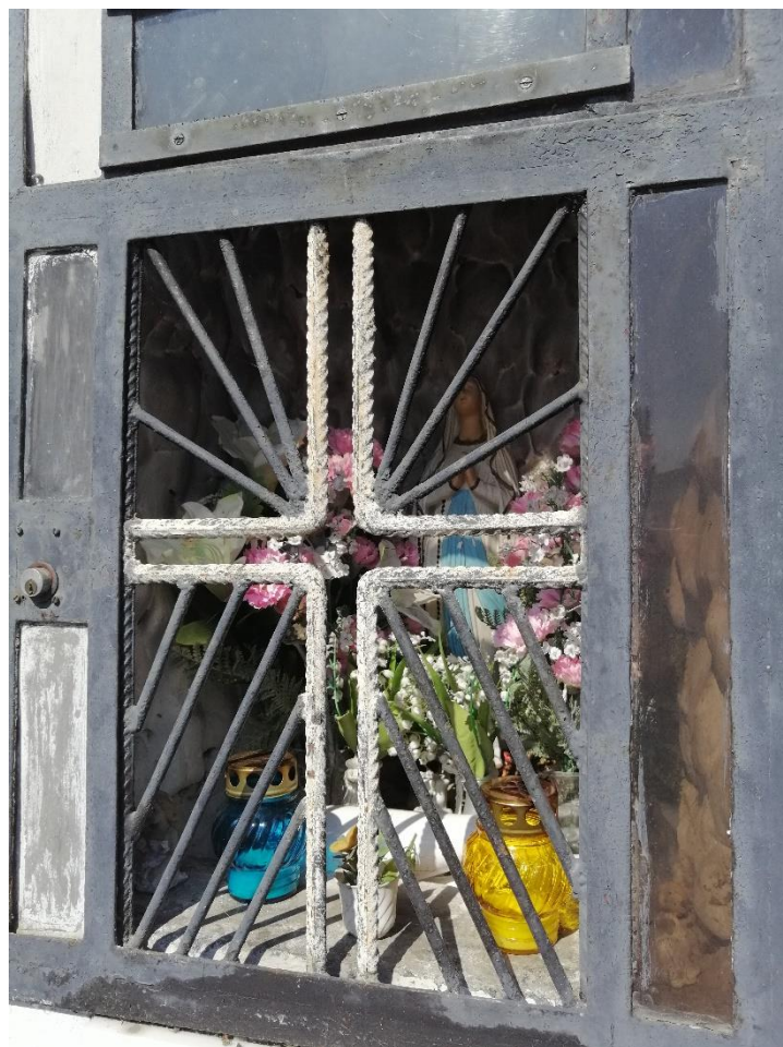
Obr. č. 9: Vnútro výklenku