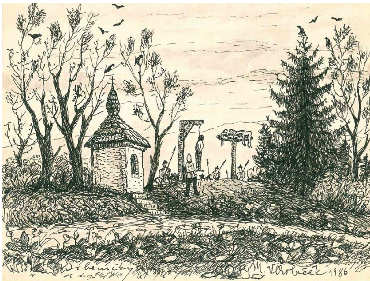
Obr. č. 6: Obrázok našich Božích múk so šibenicou v pozadí od Mojmíra Vlkočáka