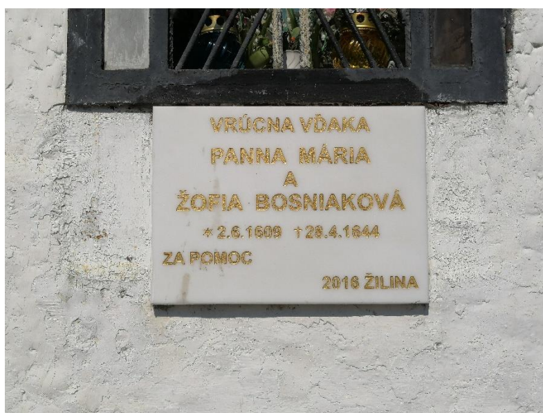
Obr. č. 10: Ďakovná tabuľa