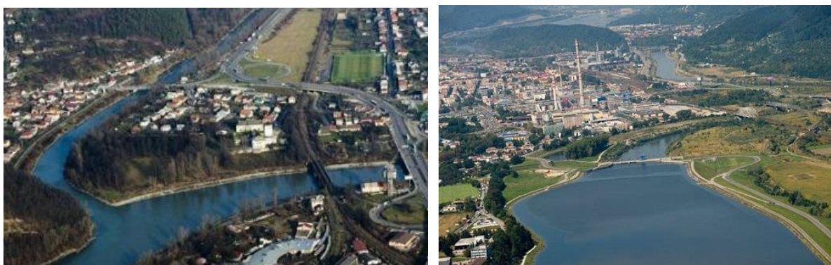
Obr. č. 12: Pred a po výstavbe vodného diela