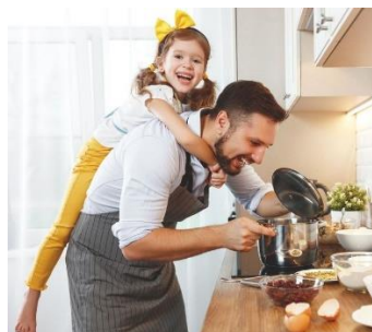
Obrázok 5 Ilustratívne foto Shutterstock