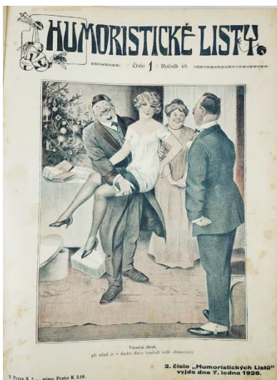
Obrázok 1 Humoristické listy 2. číslo, 1926

Časť materiálov sme našli aj v internetových zdrojoch- históriu feminizmu mapujú hlavne rôzne, na ženské práva orientované, portály ako Aspekt, magazín Apríl, Možnosť voľby. Téma feminizmu a jeho histórie sa venovala aj časť liberálne ladených denníkov napríklad SME, Denník N. Zaujímavé články boli dostupné v zborníku z konferencie Žena na hrane. 3 Pri prehľadávaní internetu sme našli aj viaceré dokumentárne filmy o Milade Horákové či Hane Gregorovej.