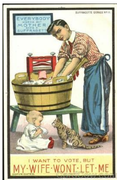
Obrázok 4 12 cruel anti-suffragette cartoons

Pokladáme za dôležité, aby sme sa ako spoločnosť nevyhýbali problematike feminizmu, ženských práv. Uvedomujeme si, že rodová rovnosť je ešte stále otázka, ktorá sa nedočkala spravodlivého riešenia. Preto, aj podľa nášho názoru, tento podcast môže pomôcť otvoreniu diskusie na spomínanú tému. Pomocou pohľadu na žien z 1. Československej republiky, ktoré sa nebáli vytýčať z davu a bojovať za svoju pravdu sa aj my môžeme inšpirovať k aktivite. Ženy dnes sú totiž mnohokrát skutočne s mužmi rovné iba na papieri. Stereotypy o žene v domácnosti sa z nášho sveta nevytrátili. Stačí jeden príklad za všetky: ak muž ostane na materskej dovolenke je často spoločnosťou odsudzovaný a vnímaný ako slaboch. Je ale na tom naozaj niečo neprirodzené?